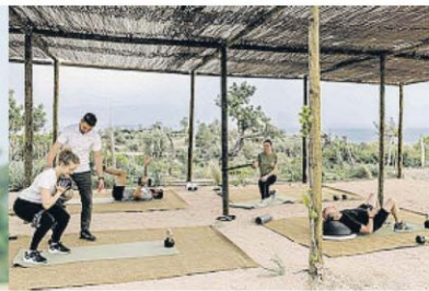
Deporte 5 estrellas Cudillero Wecamp es el destino ideal para surfistas; Camiral para golfistas y Son Bunyola, Son Net (ambos en la sierra de Tramuntana) y Mas d'en Bruno para ciclistas y senderistas, igual que Santa Marta (página izquierda)