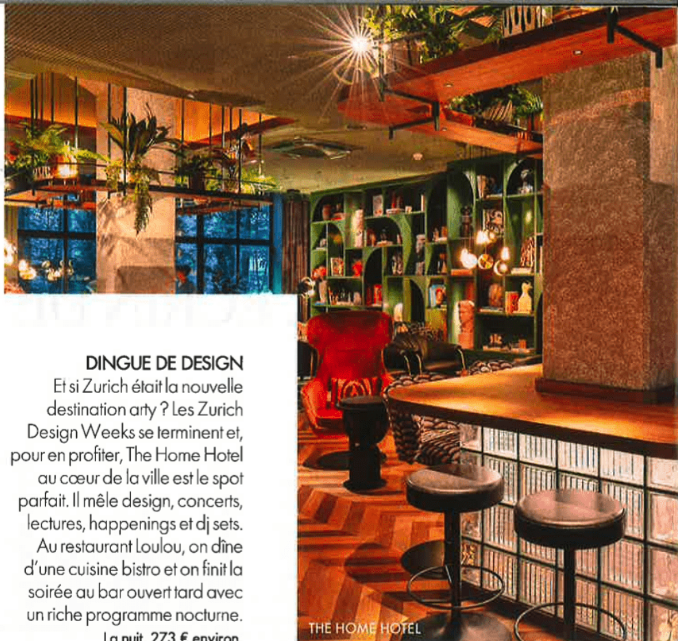
THE HOME HOTEL

Prix selon le type d'hébergements. wecamp.net